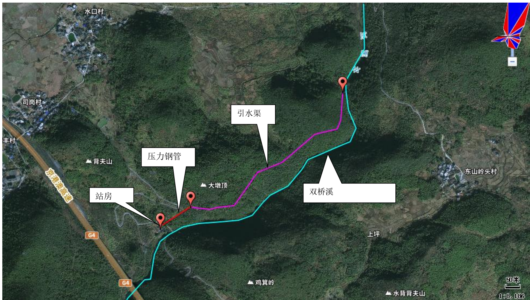
附图二 建设项目工程分布图