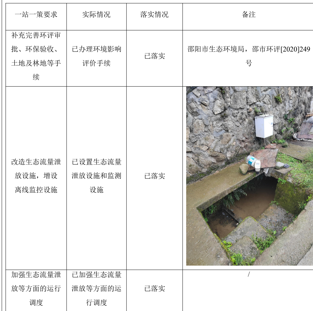
表 4-11 本项目整改情况一览表

根据《湖南省隆回县水电清理整改“一站一策”方案》，本项目的环境问题为（1）无环境影响评价手续；（2）无生态流量监测监控设施。