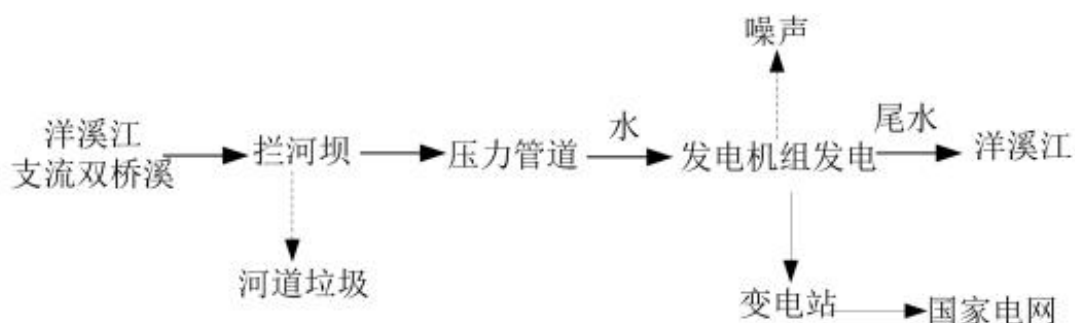
图4-1 水电站工艺流程及产污节点图

隆回县麻塘山乡双桥水电站建设项目水电站水坝位于双桥溪，大坝蓄水后水流畅经大坝拦污栅拦截河流漂浮物，水流经引水渠、压力钢管进入水轮发电机发电，发电后尾水排入双桥溪。