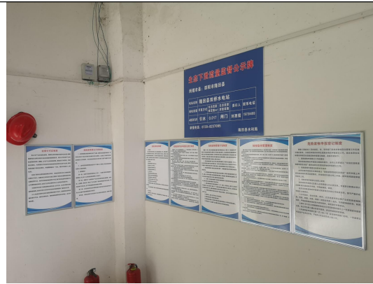
管理制度及生态下泄公示牌