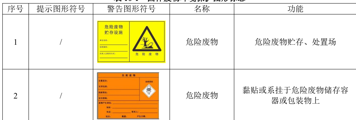
表 10-1 固体废物环境保护图形标志

根据《环境保护图形标志—固体废物贮存(处置)场》(GB15562.2-1995) 要求设置固体废物堆放场、危废仓库的环境保护图形标志下表。